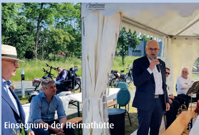
Einsegnung der Heimathütte