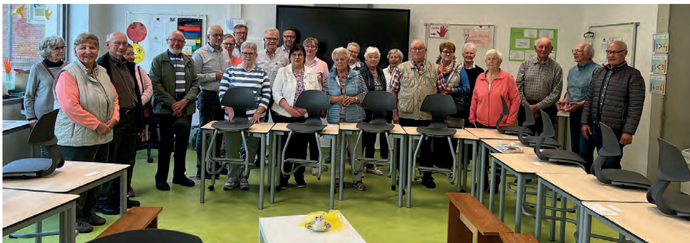
Die Gruppe des Heimatvereins in einem Unterrichtsraum, selbstverständlich nicht mehr mit einer Schiefertafel und Kreidestift ausgestattet, sondern mit einem digitalen Whiteboard.

der florierenden Textilwirtschaft entlang der Grenzregion zwischen Bocholt und Nordhorn. Das Unternehmen Gebr. Schulten beschäftigte in besten Zeiten rund 1.400 Mitarbeiter.