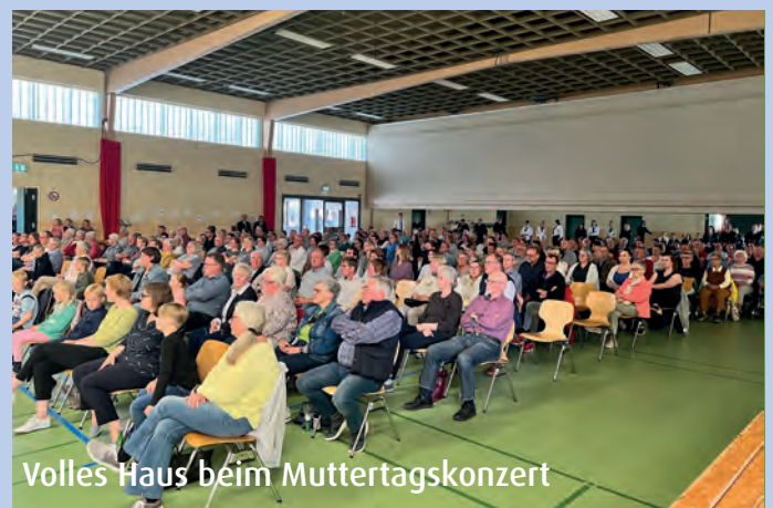
Volles Haus beim Muttertagskonzert