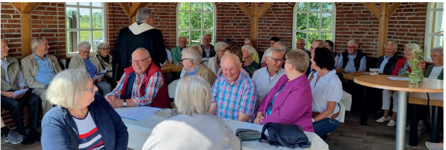
Hier wird die Größe der Heimathütte deutlich: Ca. 20 Besucher finden allein auf den gepolsterten Sitzbänken an Eichentischen Platz.

Bericht und Fotos: Heimatverein Südlohn e.V.