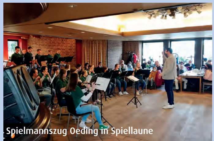
Spielmannszug Oeding in Spiellaune