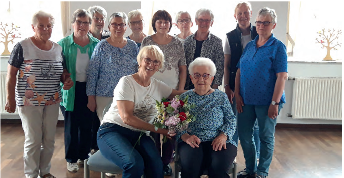
„Tanzen ist träumen mit den Füßen“

Nachdem Corona bedingt lange Zeit die Kursstunden der Tanzgruppe „Rote Rosen“ ausgefallen waren, schwingen die Mitglieder der Gruppe seit März wieder wöchentlich das Tanzbein.