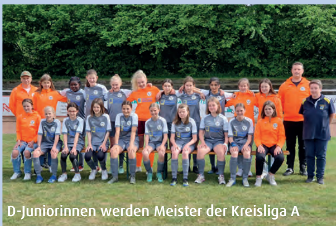
D-Juniorinnen werden Meister der Kreisliga A