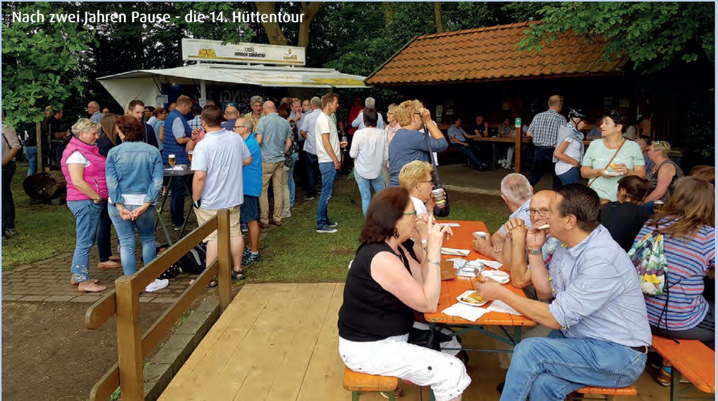
Nach zwei Jahren Pause - die 14. Hüttentour