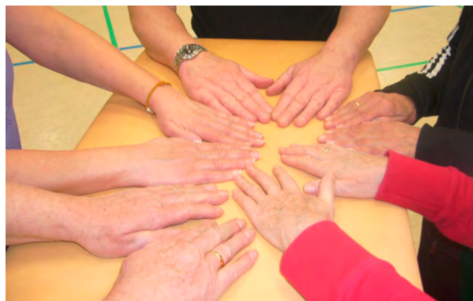
50 Jahre Breitensport SC Südlohn: Bewegt ÄLTER werden!