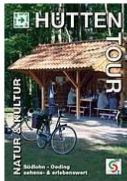
Mit neuem Gemeindeplan!