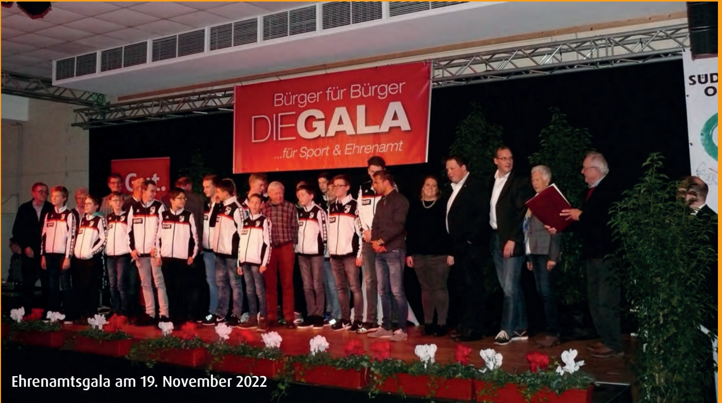
Ehrenamtsgala am 19. November 2022