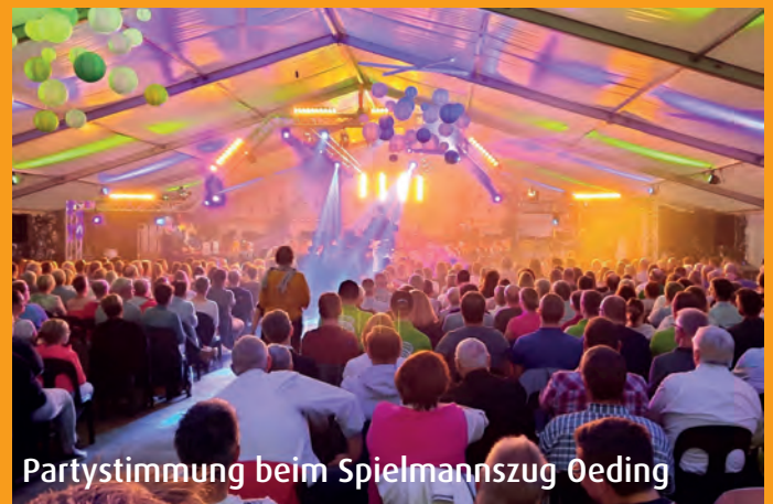
Partystimmung beim Spielmannszug Oeding