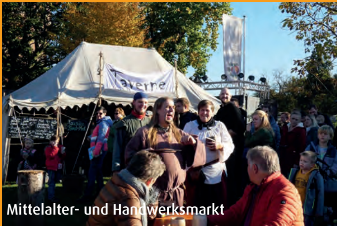
Mittelalter- und Handwerksmarkt