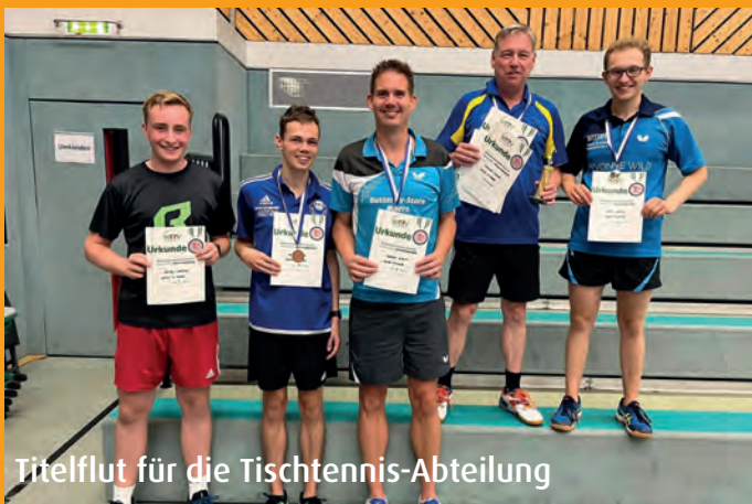
Titelflut für die Tischtennis-Abteilung