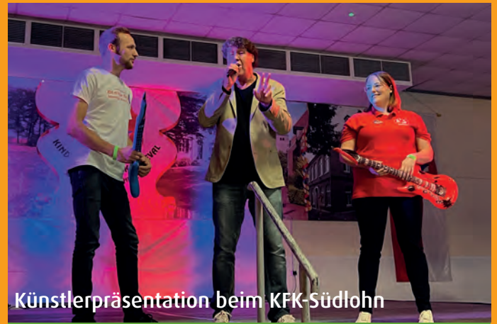
Künstlerpräsentation beim KFK-Südlohn