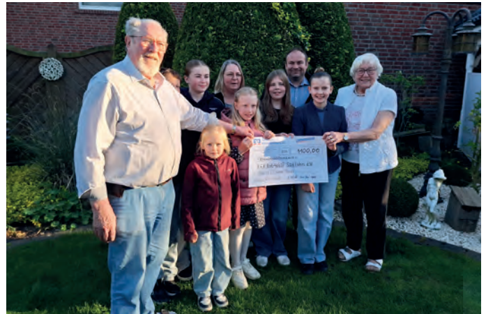
Die Kinder vom KFK sagen Dankeschön!

Am 07.11.2026 startet der KFK die neue Session mit der Prinzenvorstellung.