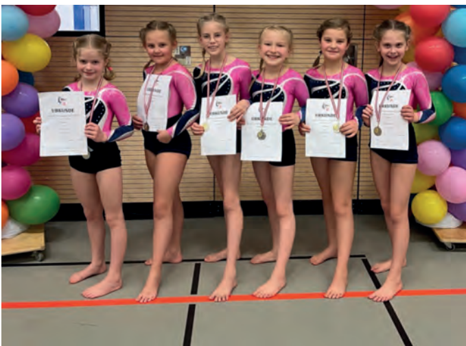
10. Platz für die jüngsten (Jg. 2017/18)