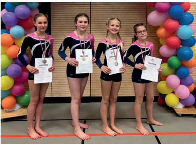
4. Platz für den Jahrgang 2013/14