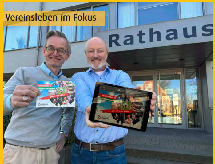
Vereinsleben im Fokus