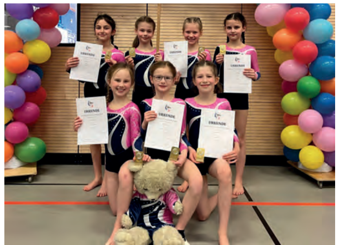
1. Platz im Jahrgang 2015/16