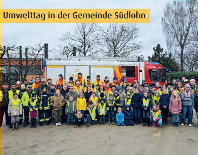
Umwelttag in der Gemeinde Südlohn