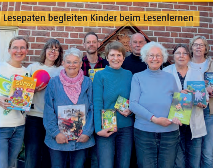
Lesepaten begleiten Kinder beim Lesenlernen