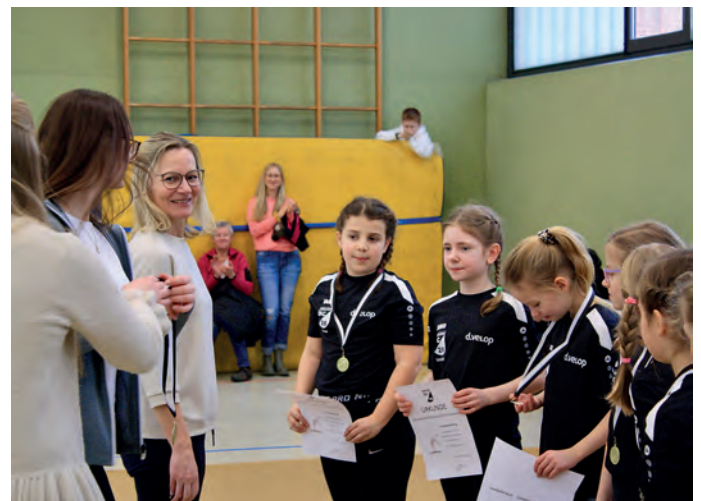
Medaillen und Urkunden für alle Turnerinnen