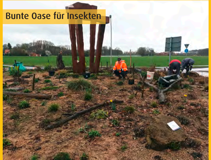
Bunte Oase für Insekten