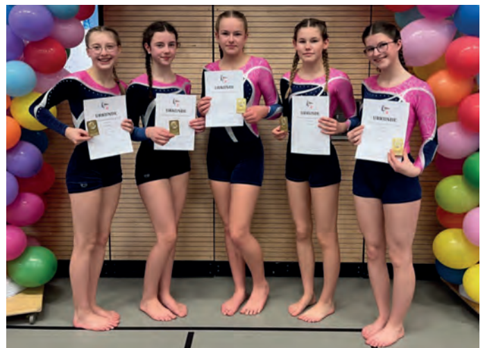
1. Platz für die Turnerinnen des Jahrgangs 2012 und älter