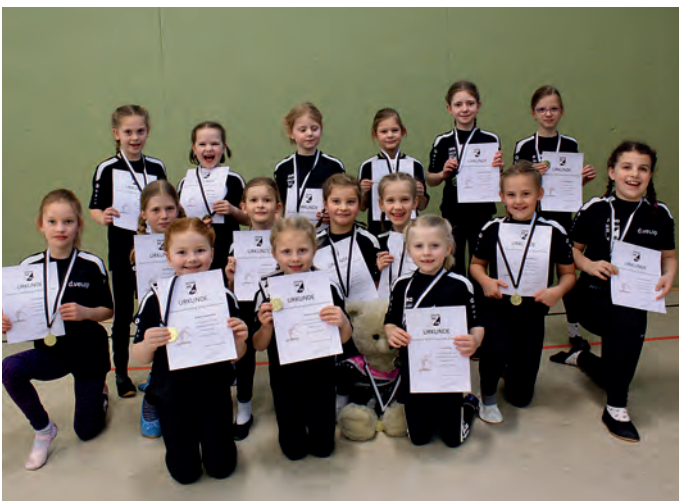
Allgemeine Riege des Gerätturnens SC Südlohn